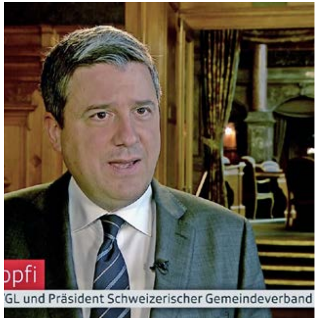
GL und Präsident Schweizerischer Gemeindeverband

Au cours de l'année sous revue, l'ACS a répondu à environ 75 demandes des médias, les thèmes les plus demandés étant l'asile (cf. NZZ am Sonntag du 12 janvier 2025), le système de milice, la cybersécurité dans les administrations communales ainsi que la limitation de vitesse à 30 km/h (cf. programme radio de la SRF Echo der Zeit du 3 septembre 2025). Au printemps, l'ACS a mené un sondage sur la communication afin de déterminer les thèmes souhaités par notre lectorat. Il en est ressorti que nos lecteurs apprécient particulièrement le magazine de l'Association «Commune Suisse» et la newsletter. Diverses suggestions de thèmes ont déjà été retenues par le service de communication en vue de l'année 2026. De plus, comme le souhait d'un échange interactif accru a été exprimé, des webinaires sur des thèmes politiques d'actualité sont prévus pour la nouvelle année.