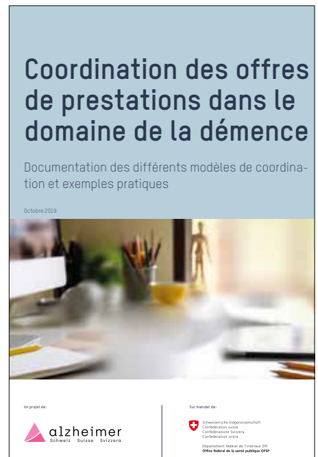
Il decorso personale della malattia richiede una presa a carico individuale e quindi un alto livello di coordinamento. Per migliorare il collegamento in rete e l'armonizzazione delle offerte, Alzheimer Svizzera propone una pubblicazione (in tedesco e francese).

Ogni caso di demenza ha un decorso diverso. Ciò significa che in Svizzera esistono circa 128000 diversi decorsi della malattia. È questo l'alto numero di persone che convivono con la demenza nel nostro paese. Secondo uno studio di Alzheimer Europe presentato a febbraio 2020, a causa dell'invecchiamento demografico della società, il numero di persone affette da demenza sarebbe destinato a raddoppiare entro il 2050. Questo comporta una sfida impegnativa per la nostra società, perché il decorso personale della malattia richiede una presa a carico individuale e quindi un alto livello di coordinamento.