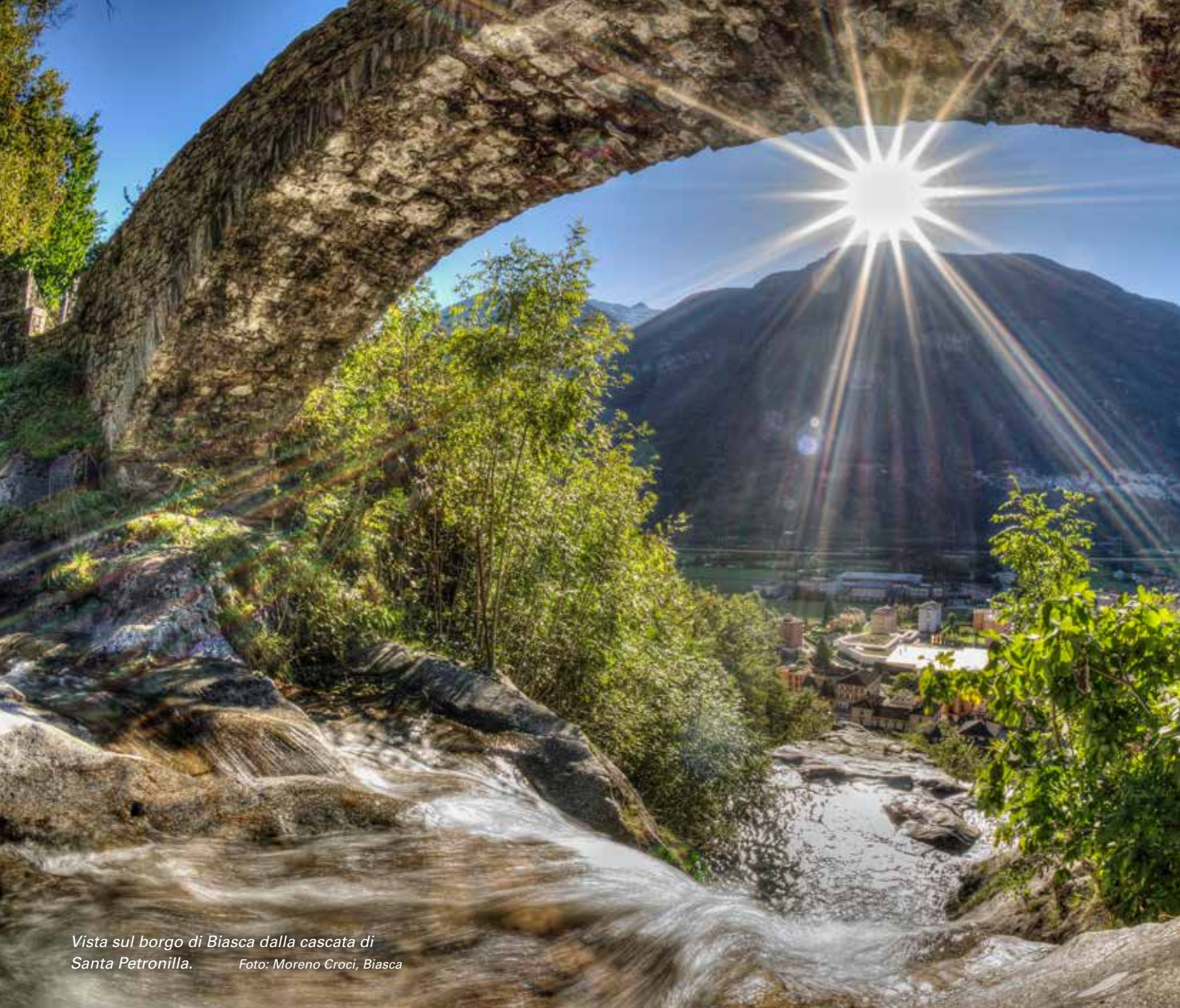
Vista sul borgo di Biasca dalla cascata di Santa Petronilla.