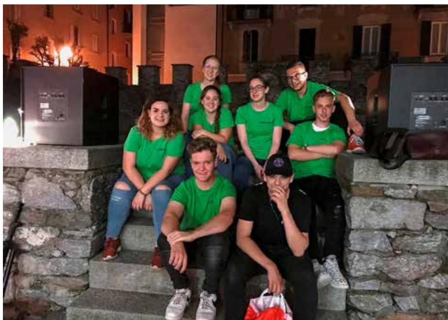
Il Comitato del Consiglio giovani biaschesi, composto da otto giovani molto motivati.