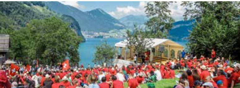
La Société suisse d'utilité publique gère la fameuse prairie du Grütli et y organise chaque année la Fête du 1 er Août.