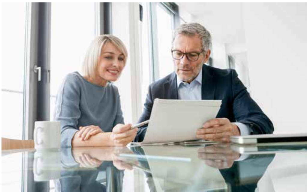
Dans le cadre du dialogue avec le centre de carrière, les nouvelles opportunités dans les communes peuvent être présentées aux responsables de la Poste.