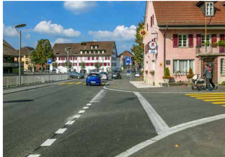
Vorher (links Bild): Die breite Strasse und die schmalen Trottoirs bewirkten eine starke Dominanz des motorisierten Verkehrs.