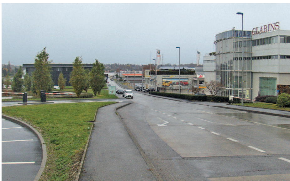
En consultation, la commune de Plan-les-Quates a obtenu le principe d'une ligne de trams qui longerait son importante zone industrielle.

Le «projet d'agglomération», tel est son nom, connaît une réelle dynamique depuis fin 2007, lorsque la Confédération s'est engagée à financer à la hauteur de 40 pour