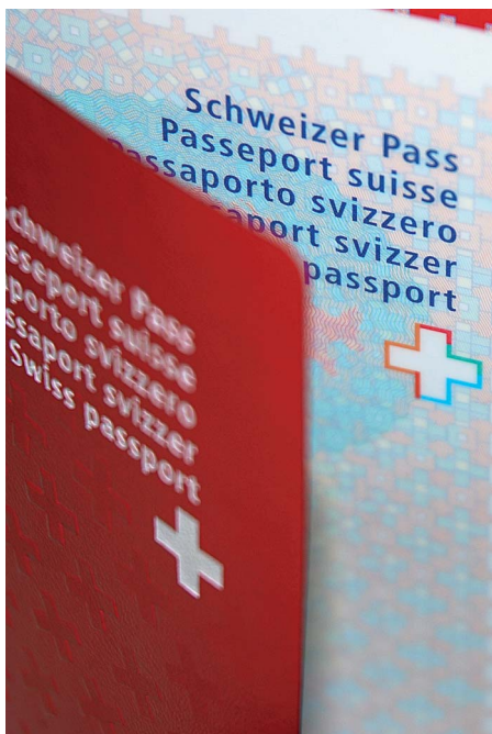
Les communes jouent un rôle capital concernant l'attribution du droit de nationalité suisse.

La modification de la loi découle de l'initiative parlementaire déposée par l'ex-conseiller aux États Thomas Pfisterer et constitue le contre-projet à l'initiative populaire «Pour des naturalisations démocratiques» rejetée le 1 er juin 2008. L'initiative populaire avait pour but d'ancrer la procédure de naturalisation en tant qu'acte souverain pur dans la LN et de clarifier ainsi la situation par rapport à l'arrêt du Tribunal fédéral datant de l'année 2003, qui avait confirmé l'invalidation de la soumission de demandes de naturalisation au vote du peuple et exigeait pour les demandes de naturalisation refusées le droit de connaître les motifs du refus. Du fait de la révision de la loi, cette pratique de naturalisation engagée par le Tribunal fédéral est désormais ancrée dans la loi. Dans l'art. 15a de la LN, la procédure de naturalisation est toutefois toujours conçue sous une forme mixte entre acte souverain et acte administratif.