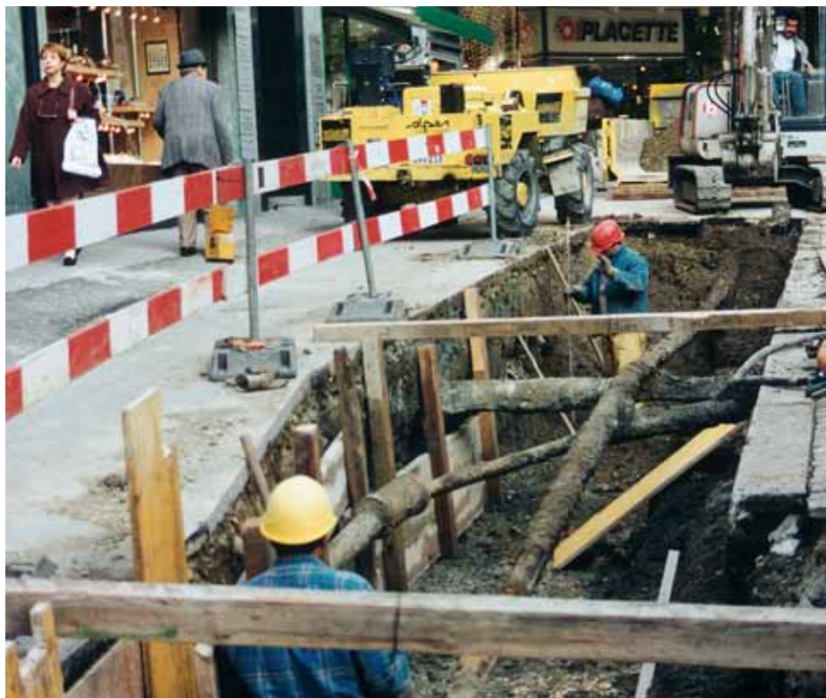
L'ouverture de chantiers sur le domaine public appelle un travail en commun des 5000 adjudicateurs en charge de ce secteur. On y travaille.

D'autant que, c'est une nouveauté qu'il convient de souligner, les réponses n'émanent plus du cercle local/régional mais elle s'élargissent à des soumissionnaires