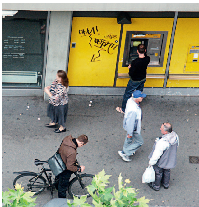
Selbstständigkeit ist laut Untersuchungen bis ins hohe Alter gewünscht.

den Enkelkindern und holen nach, was sie bei den eigenen Kindern verpasst haben. Frauen wiederum besuchen Literaturkurse. Sie geniessen es ausgiebig, keine regelmässigen Verpflichtungen mehr zu haben.