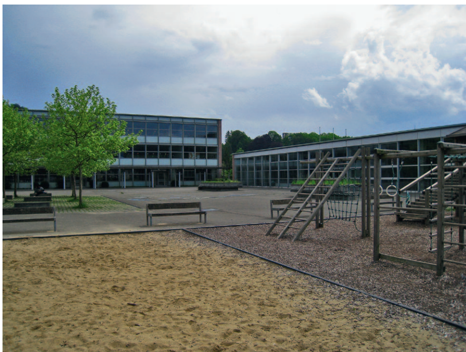
Die Schulanlage «Feld» in Schönenwerd wurde 1972 gebaut, dazu gehören auch Hallenbad und Turnhalle.

Die Gemeindebauten bilden keine Ausnahme in Sachen Energiebedarf. Es sind aber oft komplexere Gebäude als Wohnbauten: Hallenbäder, Schulkomplex mit Fernheizung zwischen den Gebäuden usw. Durch ihre Vorbildfunktion fühlen sich Gemeinden oft verpflichtet, die eigene Situation zu verbessern. Mit der energetischen Sanierung und Optimierung ihrer Anlagen und Bauten können Gemeinden zum Klimaschutz beitragen sowie auch finanziell gewinnen. Die Gemeinde Schönenwerd hat dies erkannt und den Verein Energho (siehe Kasten) beauftragt, das technische Personal des Schulkomplexes «Feld» in Sachen Betriebsoptimierung zu begleiten. Parallel dazu möchte die Gemeinde die technischen Anlagen des Hallenbads sanieren. Auch darin steckt ein grosses Energiesparpotenzial, weshalb eine Sanierungsberatung bestellt wurde.