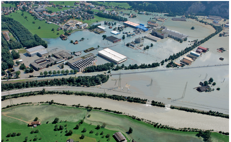
Das Hochwasser im Jahr 2005 hat das Thema Naturgefahren in das öffentliche Bewusstsein gerückt. Die klimatischen Veränderungen verschärfen die Risikosituation, so dass eine neue Risikokultur nötig ist.

Der Risikodialog hat zum Ziel, den zeitgemässen Umgang mit Naturgefahrensrissen – kurz gesagt die «Risikokultur» – in der Bevölkerung zu verankern. Die Fachleute bezeichneten in Olten den Risikodialog Naturgefahren als zentrales Instrument. Je besser jeder Einzelne die Risiken versteht, desto eher akzeptiert er die Schutzmassnahmen und sei be-