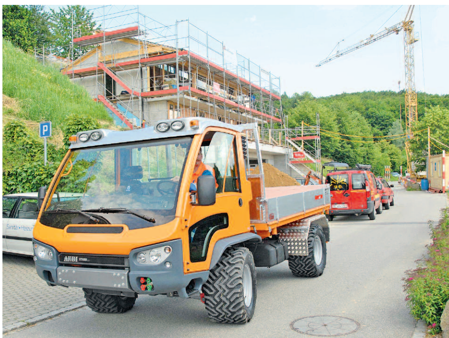
Die anstehende Totalrevision des Bundesgesetzes über das öffentliche Beschaffungswesen wird sich nicht direkt auf die Gemeinden als grösste öffentliche Auftraggeber auswirken.

Weiter sieht das geltende Recht bei Beschwerden gegen einen Zuschlag keine Erteilung der aufschiebenden Wirkung vor. In der Praxis wird zu-