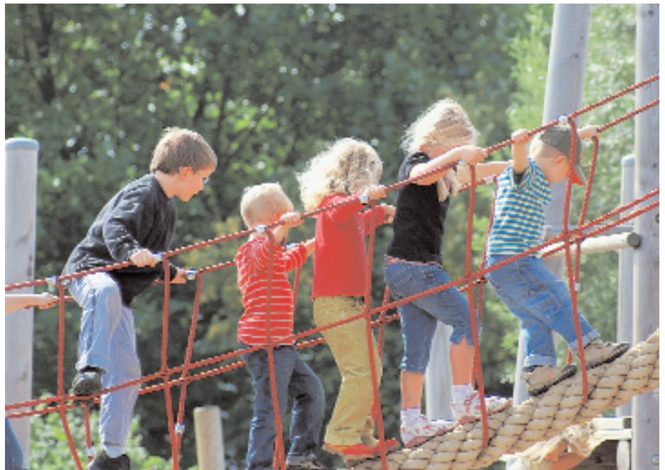
Frauen übernehmen öfter informelle Hilfeleistungen für andere Haushalte, wo sie bekannte oder verwandte Kinder aus anderen Haushalten betreuen.

Das freiwillige Engagement für Vereine und Organisationen ging seit 1997 von 27 auf 24% um rund zweieinhalb Prozentpunkte zurück. Diese Entwicklung ist bei Männern deutlicher (minus 4,2 Prozentpunkte) als bei Frauen (minus 1,1 Prozentpunkte). Unbezahlte Hilfeleistungen im privaten Umfeld wie Nachbarschaftshilfe, Kinderbetreuung und Pflegeaufgaben für andere Haushalte sind seit 2000 von 23 auf 21% um rund zwei Prozentpunkte gesunken. Diese Abnahme ist bei den Frauen mit minus 2,9 Prozentpunkten grösser als bei Männern mit 1,5 Prozentpunkten. Männer engagieren sich am häufigsten für Sportvereine, Frauen bei der Kinderbetreuung. Grundsätzlich hat sich an der Struktur der Freiwilligenarbeit nichts geändert: Männer engagieren sich häufiger für Vereine und Organisationen als Frauen (28% gegenüber 20%). Weitaus am meisten Freiwilligenarbeit wird für Sportvereine geleistet (11% der Männer gegenüber 5% der Frauen); ansonsten engagieren sich Frauen und Männer unterschiedlich stark je nach Organisationstyp. Frauen übernehmen öfter informelle Hilfeleistungen für andere Haushalte (26% der Frauen gegenüber 15% der Männer). Am häufigsten betreuen die Frauen bekannte oder verwandte Kinder aus anderen Haushalten. Bei den