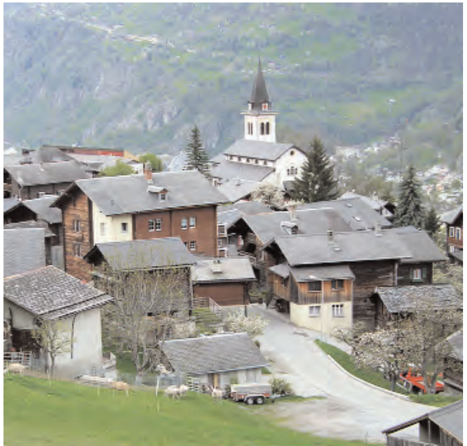
In den letzten Jahren wuchs die Bevölkerung von Termen, gleichzeitig entleert sich aber der Dorfkerne.

Doch Wohnen alleine genügt für eine Gemeinde nicht, um auch in Zukunft vital, das heisst lebenskräftig zu sein. Vitale Gemeinden sollten eine gesunde Mischung der Funktionen Wohnen, Arbeiten und Freizeit aufweisen. Denn dadurch steigt die Identifikation der Einwohner mit ihrer Gemeinde. Die Identifikation ist immer noch – genau gleich wie bei Asterix und Obelix – eine Stärke der Bergdörfer. Einwohner, die sich stark mit der Gemeinde identifizieren, setzen sich auch aktiv für deren Entwicklung ein, als Mitglied eines Vereines, in einem Vorstand oder sogar als Kandidat bei den Gemeinderatswahlen.