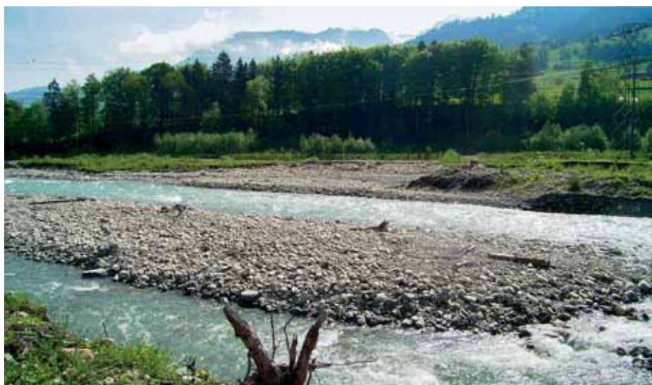
Dank Rodung und Verbreiterung des Flusslaufes entsteht eine neue Landschaft mit viel Lebensraum.

Die wilde Kander verursachte auch immer wieder Zerstörungen. Bis ins 15. Jahrhundert zurück lassen sich Hochwasser belegen, und ab etwa 1800 traten sie offenbar zunehmend auf. Um den häufigen Überschwemmungen entgegenzuwirken, realisierte man im Jahre 1714 den sogenannten Kanderdurchstich, ein für diese Zeit zwar visionäres, aber folgenschweres Unternehmen, das die Kander beim Strättlihügel direkt in den Thunersee leitete. Die fatalen Auswirkungen davon: Die Flusssohle senkte sich innert Jahren um rund 40 Meter ab. Dies führte wiederum zu mächtigen Erosionen im unteren Kandertal und zu steilwandigen, tiefen Schluchtabschnitten. Bei weiteren Korrekturen ab 1850 bis