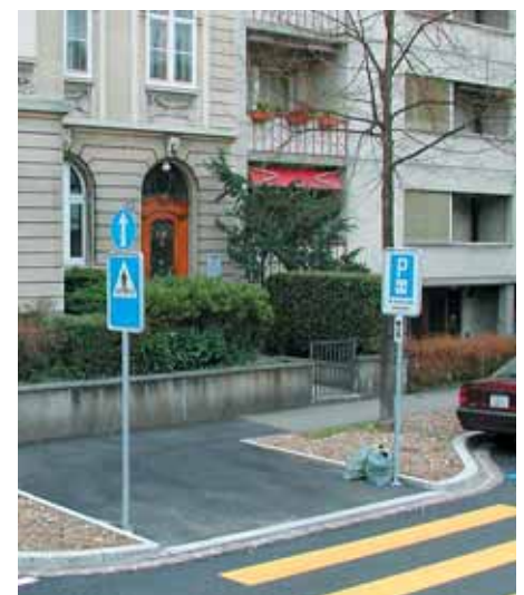
Der in Basel mit einer Trottoirnase verkürzte und damit gesicherte Fussgängerstreifen ist ein probates Mittel der Schulwegsicherung.

Eingaben sind bis 31. Mai zu senden an Fussverkehr Schweiz, Klosbachstr. 48, 8032 Zürich. Weitere Informationen unter www.flaneurdor.ch