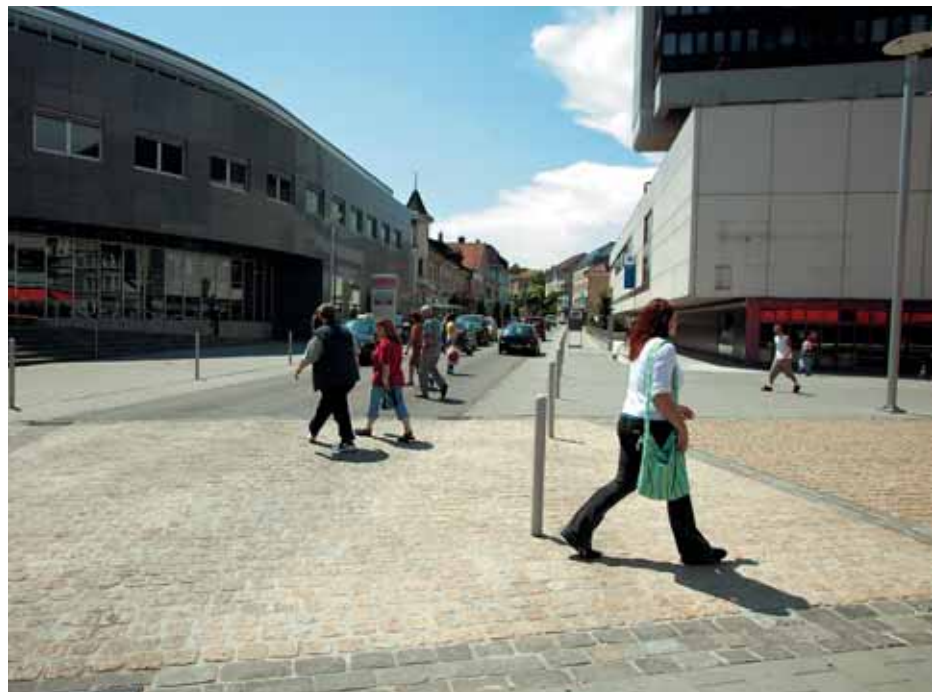
Im neu als öffentlicher Begegnungsraum gestalteten Zentrum von Grenchen wurden die Vortrittsverhältnisse zugunsten des Fussverkehrs geändert.

Für eine Gemeinde stellen sich bei einer Fusswegplanung verschiedene Fragen: Kann man sich problemlos zu Fuss in der Gemeinde bewegen? Sind die Schul- und anderen Wege sicher und attraktiv? Gibt es nur Erschliessungsstrassen oder auch Wege zwischen den Grundstücken, entlang von Gärten und Bächen? Wie oft müssen Umwege in Kauf genommen werden, oder führen die Verbindungen immer direkt und sicher zum Ziel? Gibt es Lücken im Fusswegnetz? Wirken die Quartiere und die Ortszentren ausgestorben oder belebt? Gibt es Aufenthaltsbereiche und Treffpunkte im Zentrum und auch in den Quartieren? Wie sieht es in der Dämmerung und in der Nacht aus? Sind die Wege und Plätze immer noch angenehm? Ist die Beleuchtung ausreichend?